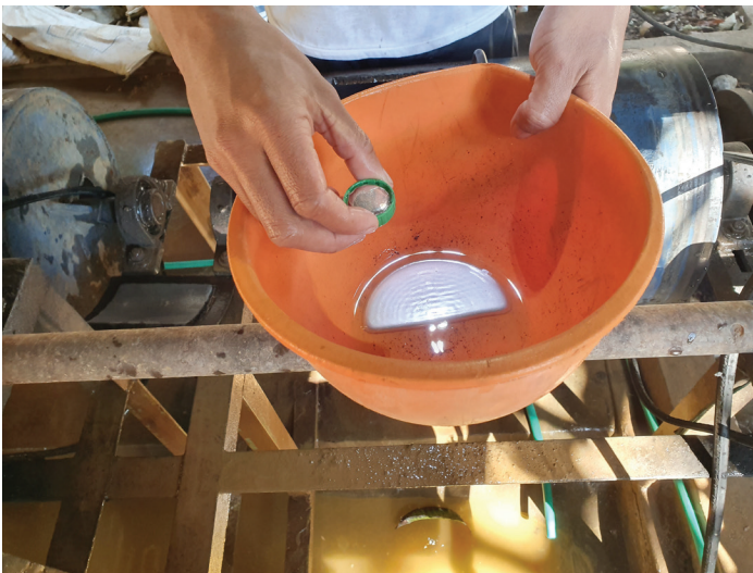
Figure 2. Site contaminé par le mercure, Indonésie.