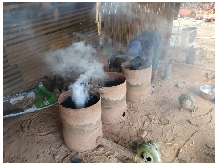
Figure 3. Usine de cyanuration contaminée au mercure en Indonésie. Stocks de résidus, rejets liquides, émissions de carbone activé rôti chargé d'or, de mercure et de cyanure. Les résidus contaminés ont été donnés comme matériaux de construction.